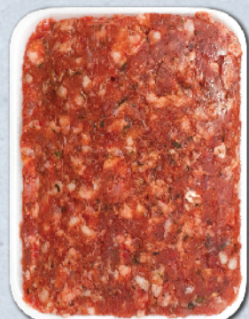
КАЙМА "ВИТОША" 60/40