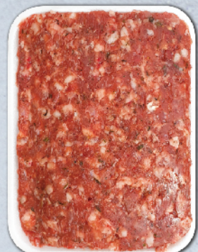
КАЙМА "ДОМАШНА" 100% СВИНСКА