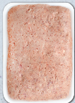
КАЙМА ЗА СКАРА "ЖАР" 100% СВИНСКО