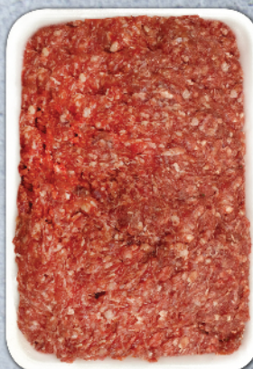
КАЙМА 100% ТЕЛЕШКА