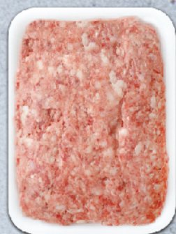
КАЙМА "МАРИЦА" 60/40