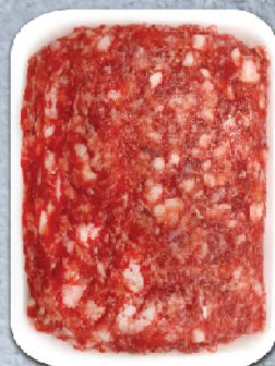
КАЙМА "РОДОПА" 50/50