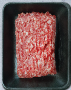
КАЙМА "ЖАР" 70/30